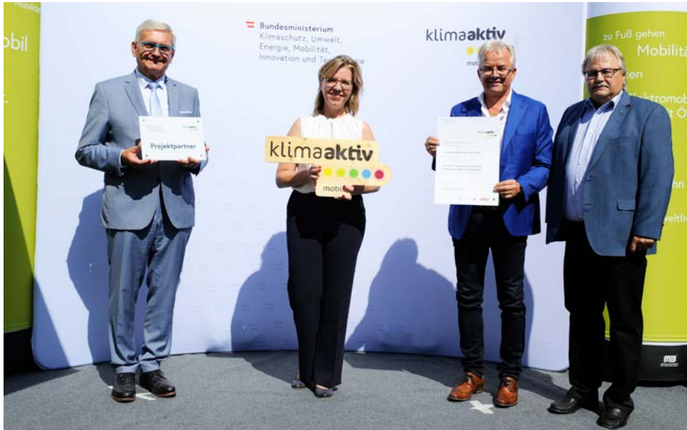
Figure 10 : La commune de Bruck/Leitha est récompensée pour avoir aménagé des pistes cyclables. En photo : Le maire Gerhard Weil et Felix Böhm avec la ministre de l'Environnement Leonore Gewessler et le président de la Fédération des communes Alfred Riedl.