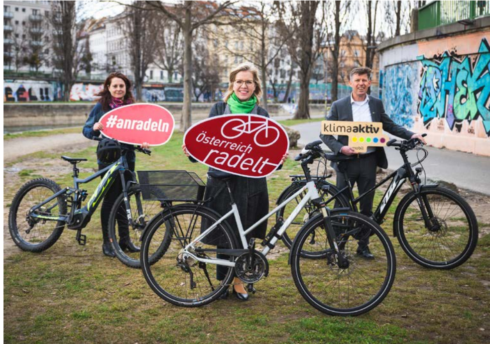
Figure 3 : La ministre de l'environnement Leonore Gewessler lance la vaste campagne autrichienne en faveur du vélo « Österreich radelt » (l'Autriche en selle).

Les programmes de conseil de klimaaktiv mobil sont également axés sur la gestion de la mobilité pour la circulation cycliste et piétonnière dans les entreprises, les villes et les communes, le tourisme et les établissements d'enseignement en Autriche.