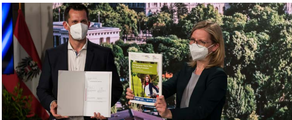
Figure 13 : Décision historique pour l'utilisation du vélo en Europe sous la présidence de l'Autriche : la ministre fédérale Leonore Gewessler et le ministre fédéral Wolfgang Mückstein présentent le premier plan directeur paneuropéen visant à promouvoir l'utilisation du vélo, adopté à Vienne sous la direction de l'Autriche et de la France.

Dans le cadre d'un premier projet de mise en œuvre, le projet DanubeCyclePlans de l'Union européenne, l'Autriche a lancé une coopération avec les pays riverains du Danube afin d'élaborer des stratégies nationales en matière d'utilisation du vélo. Quant au projet Transdanube Travel Stories, mené dans le cadre de la coopération territoriale européenne, il promeut une mobilité des touristes respectueuse du climat le long du Danube avec les Transdanube.Pearls. Ces activités seront développées à l'avenir dans le cadre du nouveau partenariat relatif à la mobilité durable dans le secteur du tourisme, conclu en lien avec THE PEP.