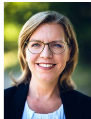
Ministre fédérale Leonore Gewessler

Grâce aux nouvelles initiatives de financement de klimaaktiv mobil, nous sommes en mesure d'aider les entreprises, les villes et les municipalités, le tourisme et les établissements d'enseignement autrichiens à faire face aux conséquences économiques de la crise sanitaire liée au Covid-19 et à préparer la voie vers une mobilité respectueuse du climat. Nous œuvrons ainsi à la protection du climat et stimulons la création de valeur régionale.