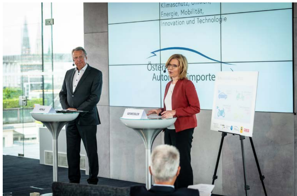
Figure 5 : Mme Leonore Gewessler, ministre de l'Environnement, et M. Günther Kerle, président du groupe de travail des importateurs de voitures au sein de l'organisation patronale Industriellenvereinigung, dévoilent les nouvelles mesures de promotion de l'électromobilité 2020.

Les instruments de soutien financier du BMK – le Fonds pour le climat et l'énergie, le Programme klimaaktiv mobil et le Programme national de promotion de l'environnement – sont mis à contribution pour déployer les opérations de financement. Afin de faciliter autant que possible la procédure, les subsides sont gérés par l'organisme Kommunalkredit Public Consulting GmbH (KPC) selon le système du guichet unique ( umweltfoerderung.at ).