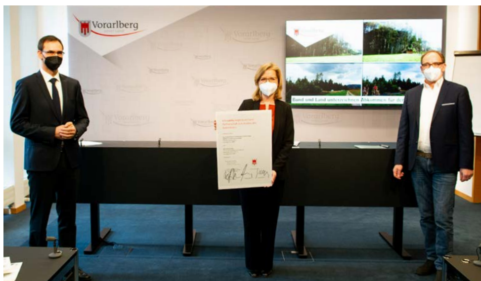
Figure 2 : La ministre de l'Environnement Leonore Gewessler, le chef de gouvernement du Land Markus Wallner et le conseiller du Land du Vorarlberg Johannes Rauch signent le partenariat fédération-land klimaaktiv mobil relatif au développement de l'infrastructure cyclable dans le Vorarlberg.

Dans le cadre des initiatives menées en réponse à la crise sanitaire, la loi sur les investissements communaux de 2020 a permis aux villes et communes de bénéficier de subsides fédéraux supplémentaires de 50 % pour le développement de la circulation cycliste et piétonnière, en combinaison avec le financement klimaaktiv mobil.