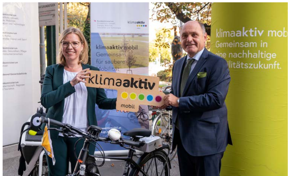
Figure 6 : Remise d'un vélo de fonction par la ministre fédérale Mme Leonore Gewessler au Président du parlement M. Wolfgang Sobotka pour le lancement de la gestion de la mobilité au parlement autrichien.