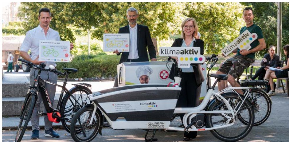
Figure 1 : La ministre de l'environnement Leonore Gewessler présente avec Michael Nendwich de la chambre de commerce autrichienne, l'opération conjointe de financement renforcé sur les vélos électriques de transport, en collaboration avec les vendeurs de vélo du pays. Des opérateurs de flotte innovants, tels que l'Association autrichienne des Samaritains, misent sur l'utilisation d'e-cargobikes.

Avec le programme de financement klimaaktiv mobil et la refonte de la directive de financement klimaaktiv mobil, le BMK met en œuvre le développement du financement fédéral pour la circulation cycliste et la création de nouveaux dispositifs d'aide financière à la circulation piétonnière, en application du programme adopté par le gouvernement. Le BMK a ainsi multiplié par dix, avec effet immédiat, le financement de klimaaktiv mobil pour la circulation cycliste et la gestion de la mobilité, portant la dotation à environ 40 millions d'euros en 2020 et 2021, et l'a assorti d'une nouvelle campagne axée sur le développement de la circulation piétonnière à partir de 2021.