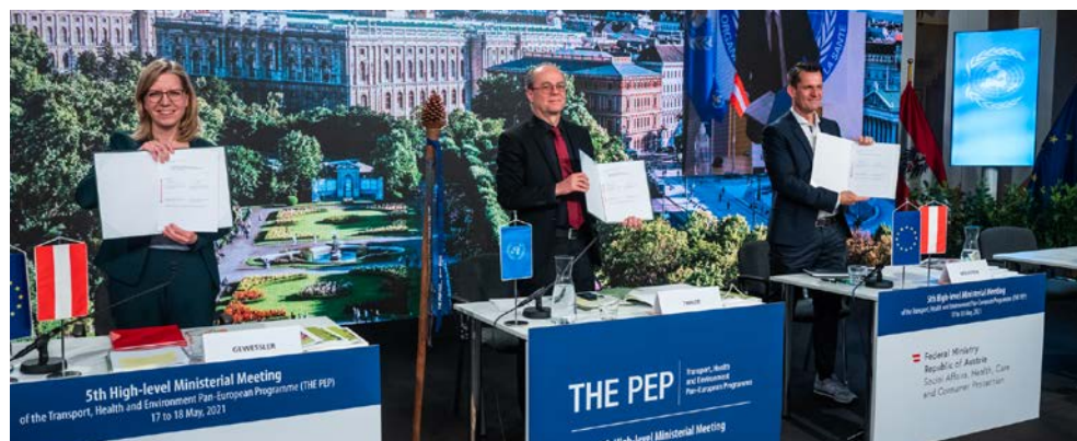
Figure 12 : Une étape importante est franchie vers une mobilité saine et respectueuse du climat en Europe : accompagnés du président autrichien de THE PEP Robert Thaler, la ministre fédérale Leonore Gewessler et le ministre fédéral Wolfgang Mückstein présentent la déclaration ministérielle de Vienne « Building forward better by transforming to new, clean, safe, healthy and inclusive mobility and transport », adoptée lors de la 5e conférence ministérielle paneuropéenne consacrée aux transports, à la santé et à l'environnement.

Élaborée et négociée sous l'égide de Robert Thaler, membre du BMK et président autrichien du Programme paneuropéen pour les transports, la santé et l'environnement, la déclaration ministérielle de Vienne « Building forward better by transforming to new, clean, safe, healthy and inclusive mobility and transport » a été adoptée sous la présidence de la ministre fédérale Leonore Gewessler et du ministre fédéral Wolfgang Mückstein. Elle jette ainsi les bases d'une mobilité active et respectueuse du climat au niveau paneuropéen, dans les 56 États participants. Dans la déclaration de Vienne, les ministres européens des Transports, de la Santé et de l'Environnement ont convenu de l'élaboration d'une stratégie paneuropéenne pour développer une mobilité respectueuse du climat et adopté des recommandations visant à faire face aux répercussions de la crise de la Covid-19 dans les transports en mettant sur pied un système de mobilité bénéfique pour la santé et respectueux du climat.